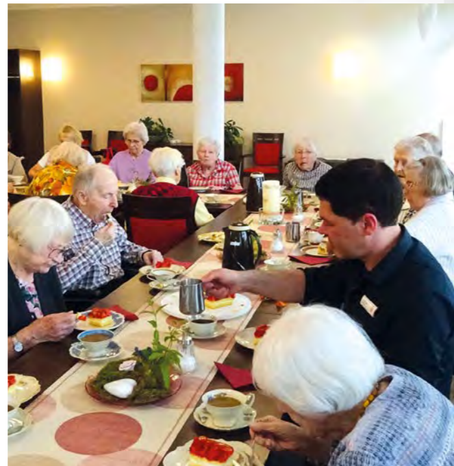
Sämtliche Personenbezeichnungen gelten gleichwohl für alle Geschlechter.

22 Veranstaltungen Oktober 2023 bis Januar 2024