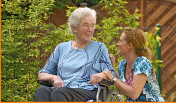
CMS – Mit Sicherheit die richtige Wahl