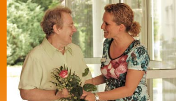
Wir begegnen Ihnen mit Offenheit und Respekt

Gerne beraten wir Sie persönlich und führen Sie durch unser Haus.