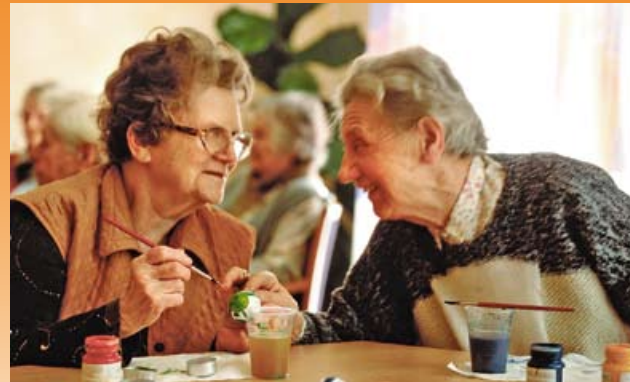
Geselligkeit und Lebensfreude bis ins hohe Alter

Unsere Mitarbeiter organisieren eine Vielzahl regelmäßig stattfindender Veranstaltungen. Das Angebot orientiert sich dabei natürlich stets an den Wünschen unserer Bewohner. Gern gesehen sind auch Gäste jeden Alters aus der Nachbarschaft unseres Hauses.