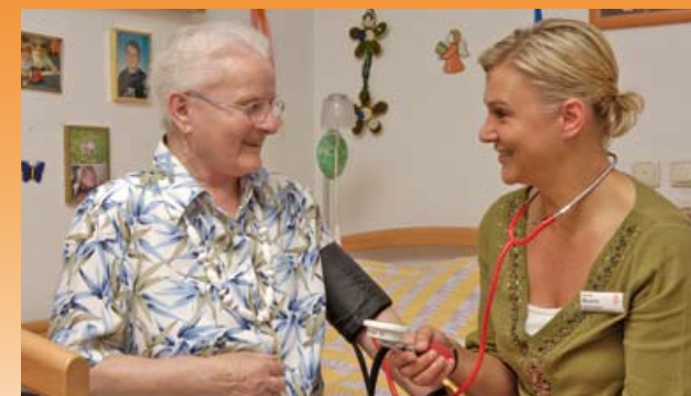
Unser geschultes Personal achtet auf Ihre Gesundheit

Um dies zu gewährleisten, liegen uns sowohl die soziale Kompetenz, als auch die fachliche Qualifikation der Mitarbeiter besonders am Herzen.