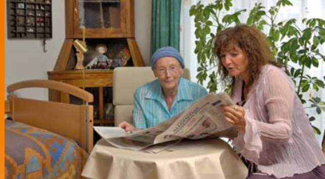
Empfangen Sie Ihre Gäste in den eigenen vier Wänden

Die Leitung und die Mitarbeiter des Hauses