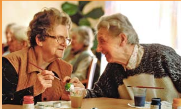
Geselligkeit und Lebensfreude bis ins hohe Alter

Unsere Mitarbeiter organisieren eine Vielzahl regelmäßig stattfindender Veranstaltungen. Das Angebot orientiert sich dabei natürlich stets an den Wünschen unserer Bewohner. Gern gesehen sind auch Gäste jeden Alters aus der Nachbarschaft unseres Hauses.