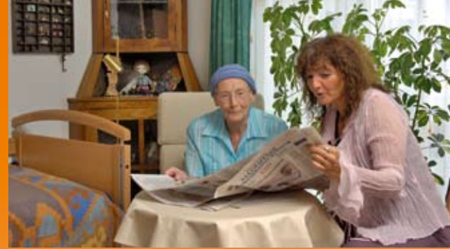
Empfangen Sie Ihre Gäste in den eigenen vier Wänden

Die Leitung und die Mitarbeiter des Hauses