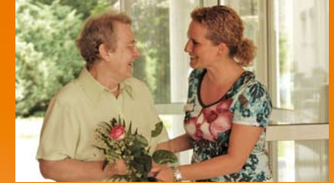
Wir begegnen Ihnen mit Offenheit und Respekt

Gerne beraten wir Sie persönlich und führen Sie durch unser Haus.