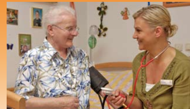
Unser geschultes Personal achtet auf Ihre Gesundheit

Um dies zu gewährleisten, liegen uns sowohl die soziale Kompetenz, als auch die fachliche Qualifikation der Mitarbeiter besonders am Herzen.