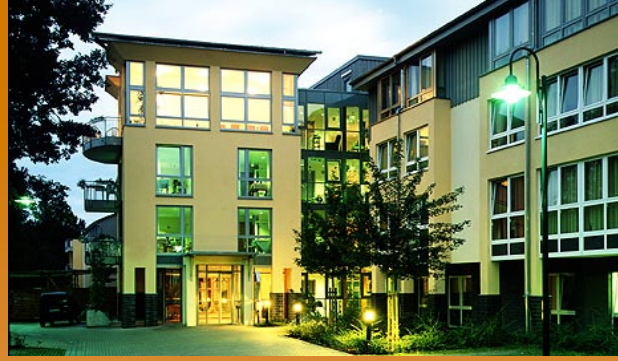
CMS – Mit Sicherheit die richtige Wahl