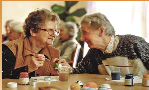
Geselligkeit und Lebensfreude bis ins hohe Alter

Unsere Mitarbeiter organisieren eine Vielzahl regelmäßig stattfindender Veranstaltungen. Das Angebot orientiert sich dabei natürlich stets an den Wünschen unserer Bewohner. Gern gesehen sind auch Gäste jeden Alters aus der Nachbarschaft unseres Hauses.