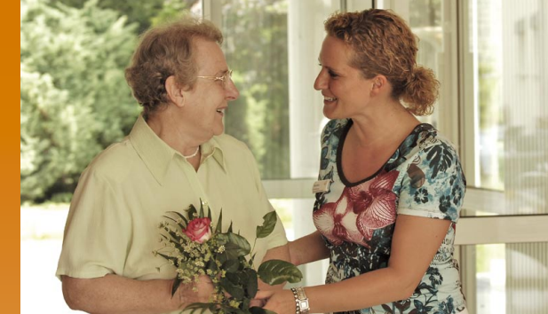
Wir begegnen Ihnen mit Offenheit und Respekt

Gerne beraten wir Sie persönlich und führen Sie durch unser Haus.