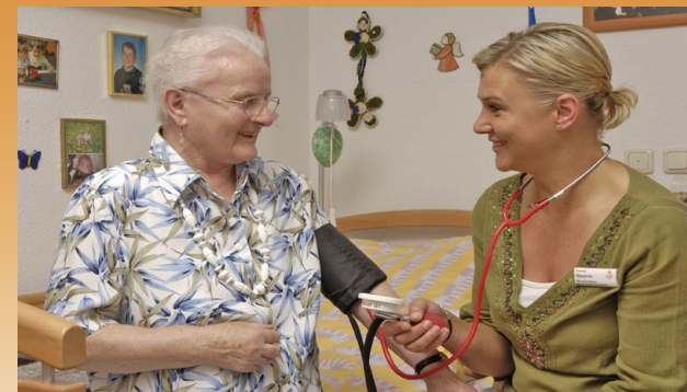
Unser geschultes Personal achtet auf Ihre Gesundheit

Um dies zu gewährleisten, liegen uns sowohl die soziale Kompetenz, als auch die fachliche Qualifikation der Mitarbeiter besonders am Herzen.