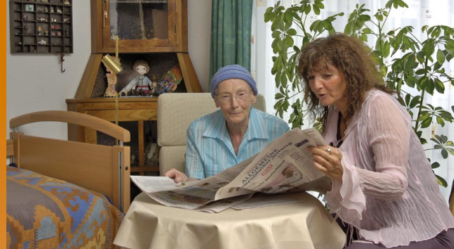
Empfangen Sie Ihre Gäste in den eigenen vier Wänden

Die Leitung und die Mitarbeiter des Hauses