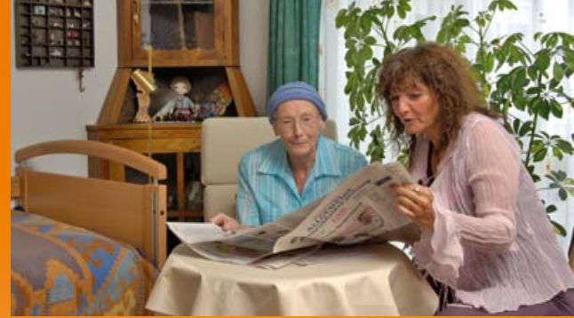
Empfangen Sie Ihre Gäste in den eigenen vier Wänden

Zusammen mit Bistro-Café, Garten, Terrasse, Therapie- und Gemeinschaftsräumen bieten wir ein angenehmes, wohnliches Ambiente.