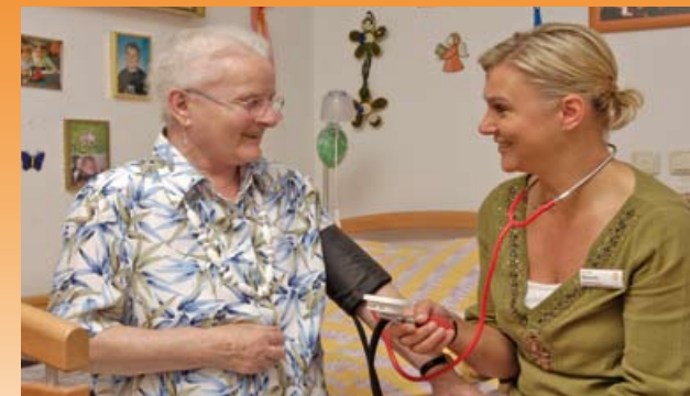
Unser geschultes Personal achtet auf Ihre Gesundheit

Um dies zu gewährleisten, liegen uns sowohl die soziale Kompetenz, als auch die fachliche Qualifikation der Mitarbeiter besonders am Herzen.